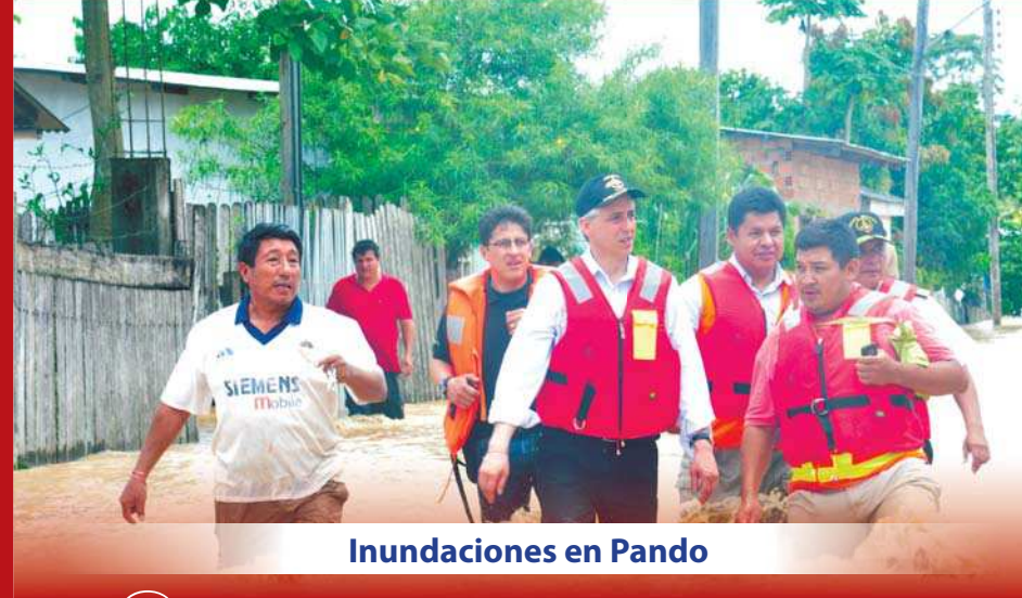
Inundaciones en Pando

A consecuencia de las precipitaciones pluviales que ocasionaron el desborde del Río Acre, el pasado 18 de febrero, ocho barrios de la capital pandina quedaron inundados.