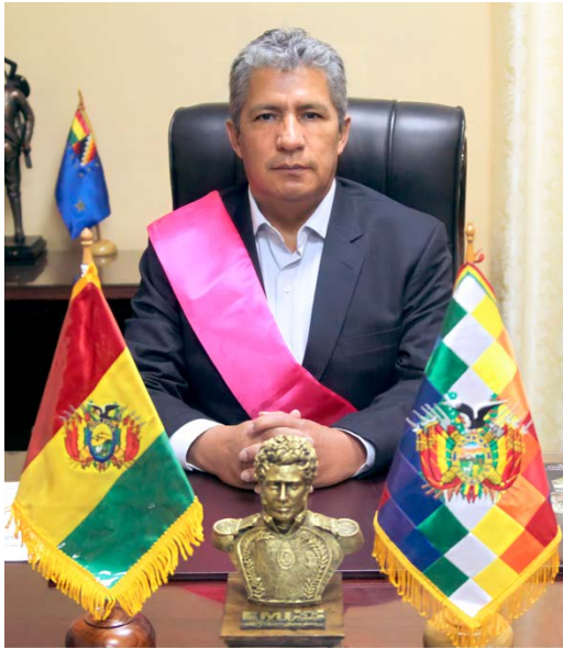
Abg. Edmundo Novillo Aguilar MINISTRO DE DEFENSA

En la presente Rendición Pública de Cuentas Inicial, corresponde presentar los objetivos y actividades relevantes, así como los resultados esperados por el Ministerio de Defensa para la gestión 2022.