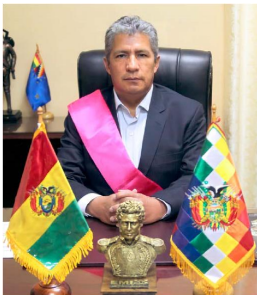
Abg. Edmundo Novillo Aguilar MINISTRO DE DEFENSA

El presente Informe de Rendición Pública de Cuentas Inicial 2023, fue elaborado en cumplimiento a lo dispuesto en la Constitución Política del Estado sobre la responsabilidad de todo servidor público de informar acerca de la administración de los recursos otorgados por el Estado y los resultados que se espera lograr al final de la gestión fiscal.