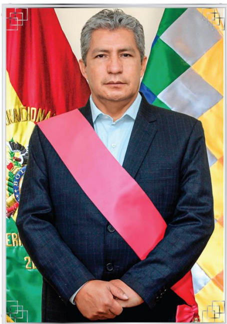
EDMUNDO NOVILLO AGUILAR MINISTRO DE DEFENSA DEL ESTADO PLURINACIONAL DE BOLIVIA

El presente informe de Rendición Pública de Cuentas Final 2024 del Ministerio de Defensa, se constituye en un acto de transparencia y responsabilidad enmarcado en el cumplimiento del Artículo 235, numeral 4 de la Constitución Política del Estado, que establece la obligación de los servidores públicos de rendir cuentas sobre sus responsabilidades económicas, políticas, técnicas y administrativas en el ejercicio de la función pública.