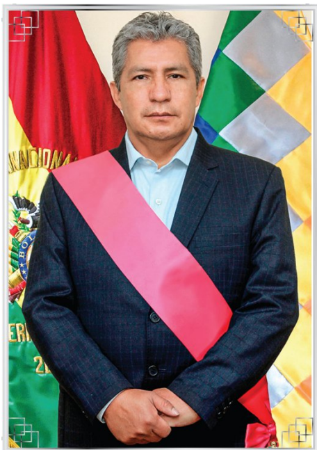
EDMUNDO NOVILLO AGUILAR MINISTRO DE DEFENSA

El presente Informe de Rendición Pública de Cuentas Inicial 2024, fue elaborado en cumplimiento a lo dispuesto en la Constitución Política del Estado sobre la responsabilidad de todo servidor público de informar acerca de la planificación y presupuesto institucional, resaltando los resultados esperados para la presente gestión fiscal.