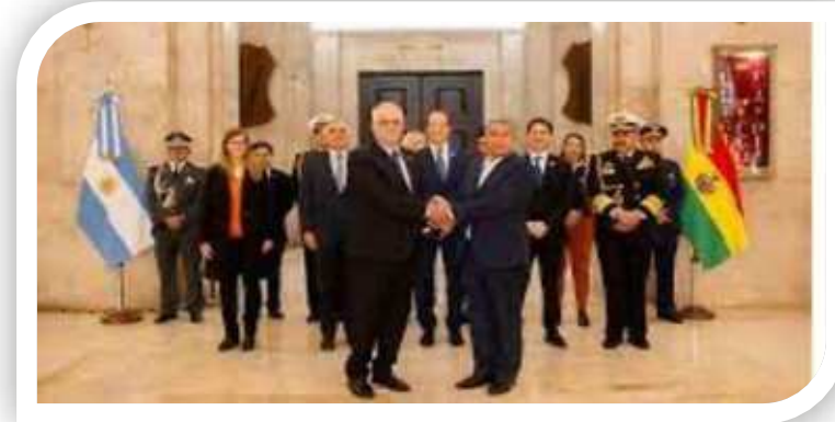
Acuerdo de Cooperación suscrito con el Ministerio de Defensa de Argentina