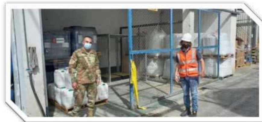
Inspección del acondicionamiento de depósitos para sustancias químicas controladas