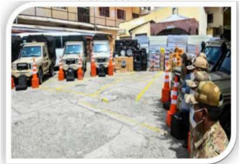
Vehículos con equipo de red de comunicación