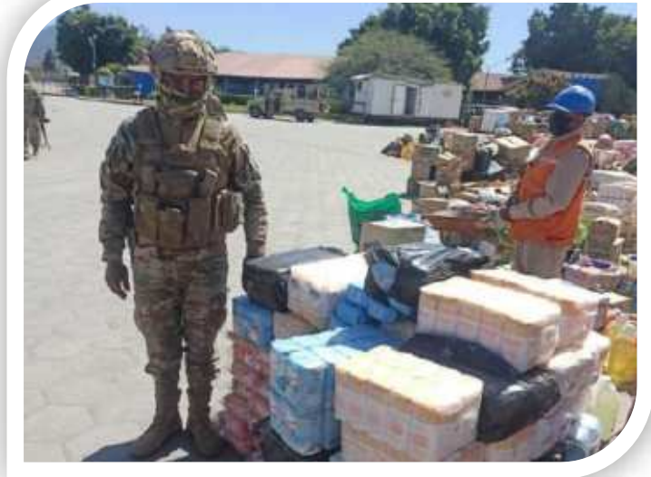
Comiso de mercancía de contrabando