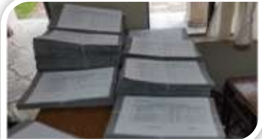
Entrega de Copias Legalizadas de Libretas Militares