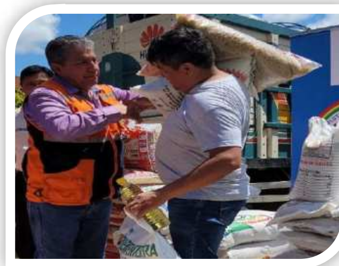
Entrega de alimentos a familias damnificadas