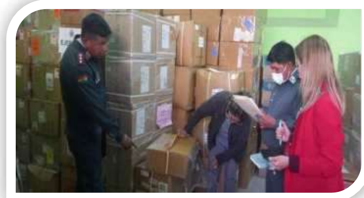
Entrega de dotación de medicamentos al personal de Soldados y Marineros de las FF.AA