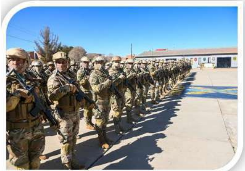
Contingente Militar en la lucha contra el contrabando