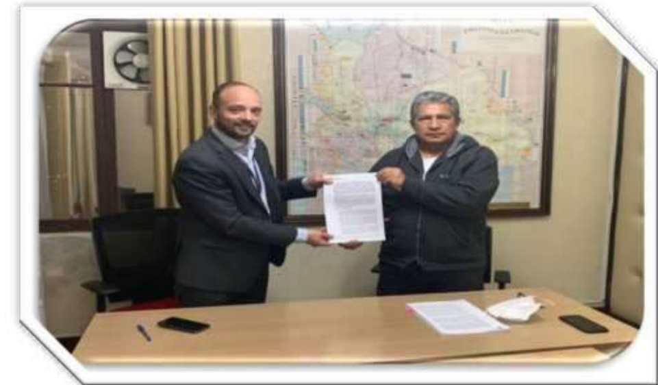
Gestión de negociación del Ministro de Defensa con la Empresa THALES