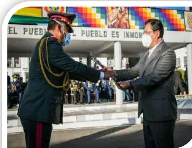
Dotación de pistolas, sables y espadas a egresados de Institutos Militares