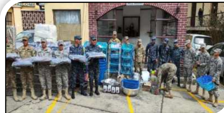
Dotación de colchones y utensilios para Personal de Guardia del Ministerio de Defensa