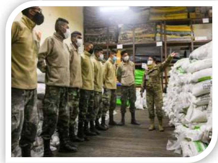
Entrega de víveres a Unidad Militar