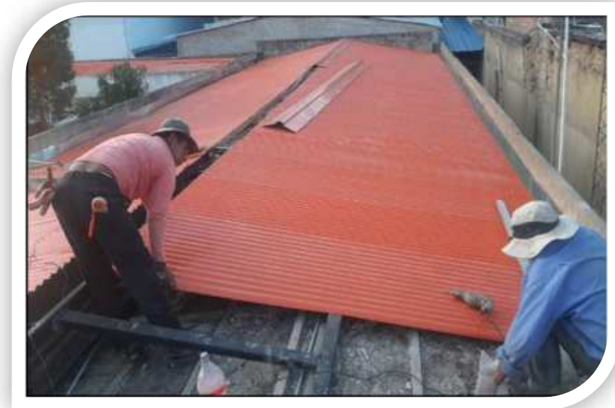
Cambio de Cubierta

Se fortaleció las condiciones de infraestructura con obras de refacción, mantenimiento y construcciones menores en 15 unidades militares de las Fuerzas Armadas y Ministerio de Defensa con 293.310 Bs.