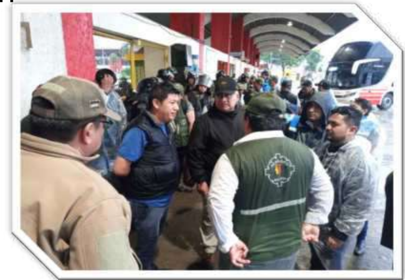
Supervisión y Control del VLCC en la Bimodal de la ciudad de Santa Cruz