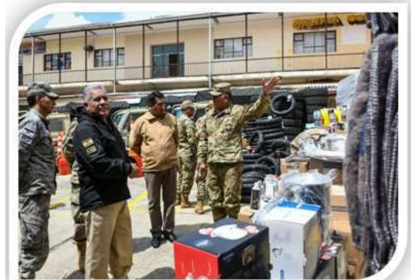
Entrega de equipamiento y material al CEOLCC