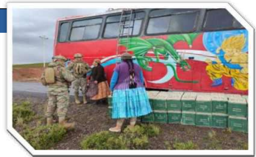
Efectivos del CEOLCC en interdicción al contrabando