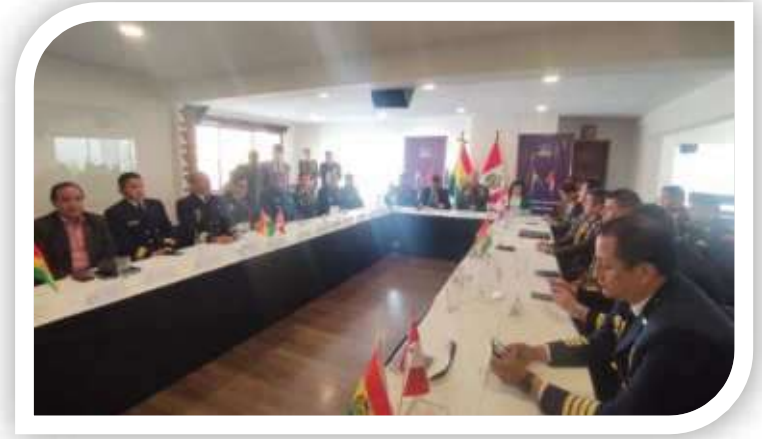
Reunión de la Comisión Binacional Fronteriza (COMBIFRON) Bolivia – Perú