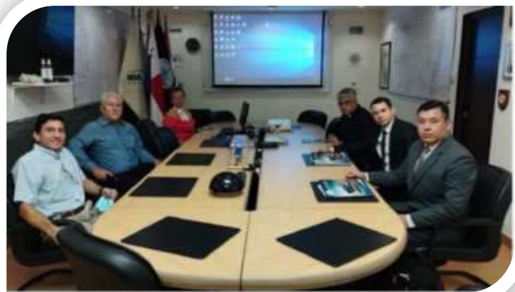
Reunión técnica con Organización Reconocida de Protección