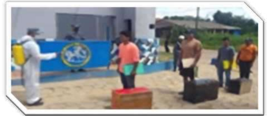
Reclutamiento 1er. Esc. Cat. 2022