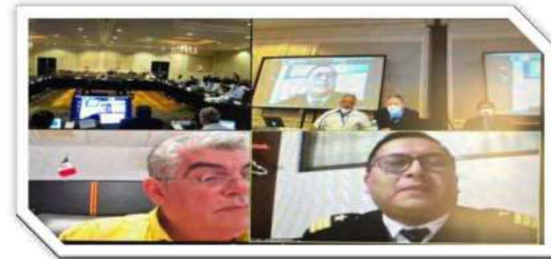
Participación en línea, en la 100ª Reunión de la Comisión Interamericana del Atún Tropical (CIAT)