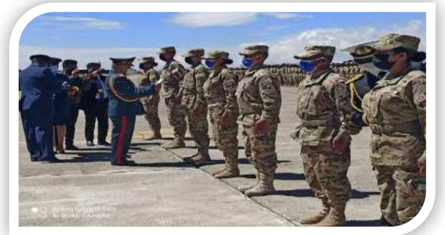
Licenciamiento Premilitares Cat. 2021-2022