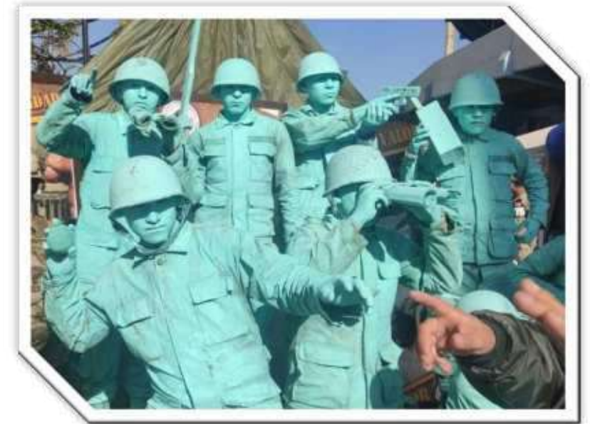
Feria Contra el Racismo y Toda Forma de Discriminación en Cochabamba