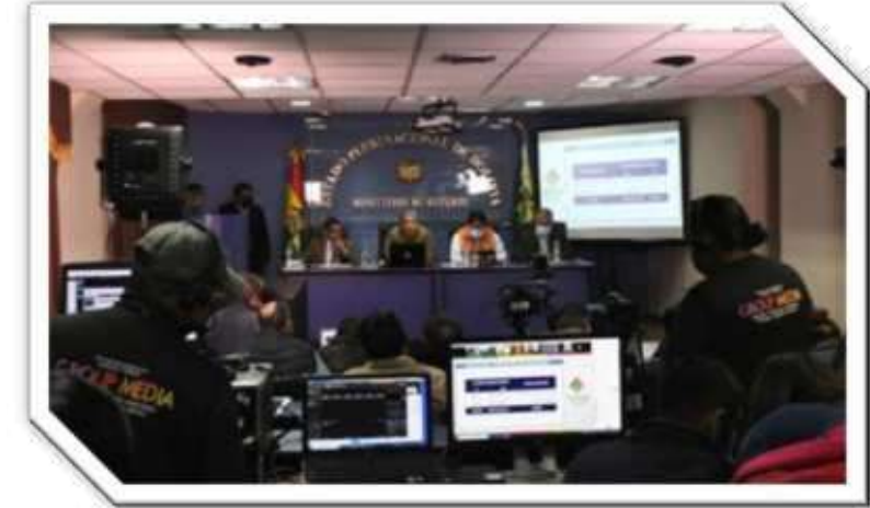
Rendición Pública de Cuentas Final 2021