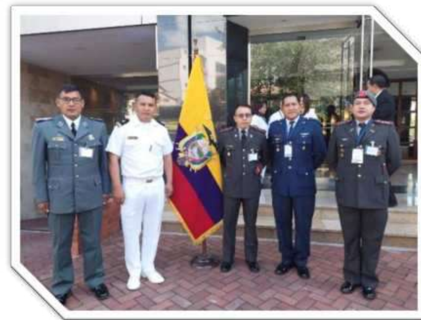
Curso sobre inspecciones técnicas desarrollado en Quito - Ecuador.