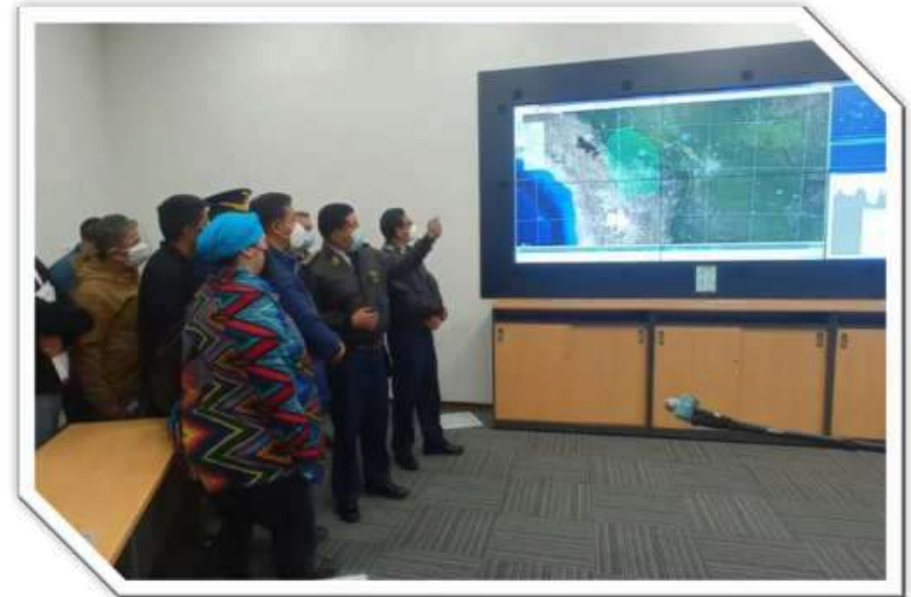
Presidente del Estado Plurinacional y su gabinete inspecciona el SIDACTA

Asimismo, para la operación de la aviación comercial se tiene avanzado los acuerdos técnicos operativos y homologación con la DGAC y NAABOL, los que se concretarán mediante convenio en las próximas semanas.