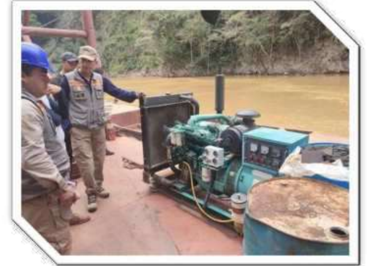
Inspecciones y registro de embarcaciones