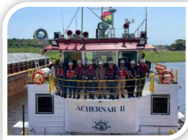
Artefacto Naval con registro de bandera boliviana