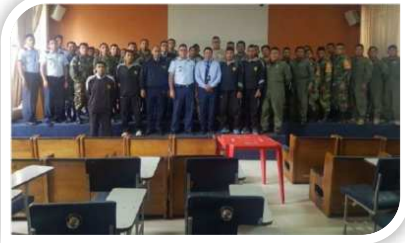
Curso de inducción AVSEC, impartido por la DGAC a la DIRESA Cochabamba.