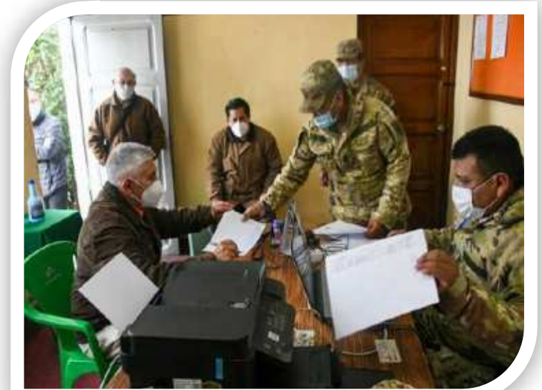
Entrega de Víveres al Servicio Pasivo y Reserva Activa