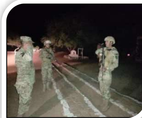
Inspección al PMA “Sbtte. Antonio Arévalo La Serna”