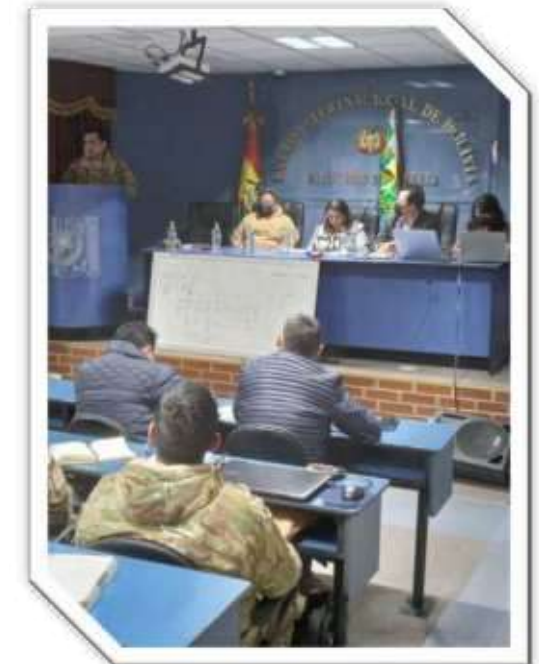
Socialización Código de Ética