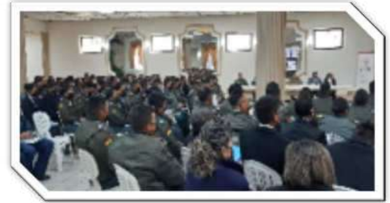
8vo curso de DD.HH y D.I.H realizado en la ciudad de Oruro