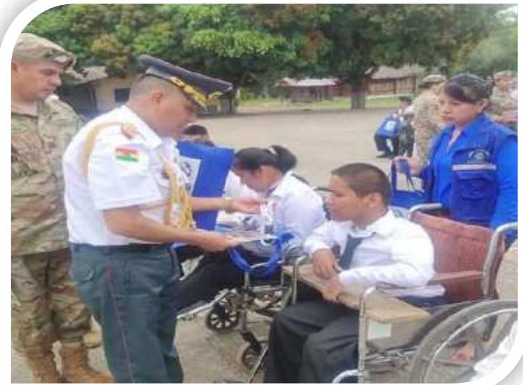
Entrega de Libretas a personas con discapacidad en el Trópico