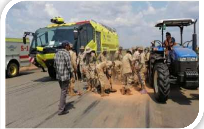
Apoyo a trabajos de bacheo a la pista del Aeropuerto de Riberalta.