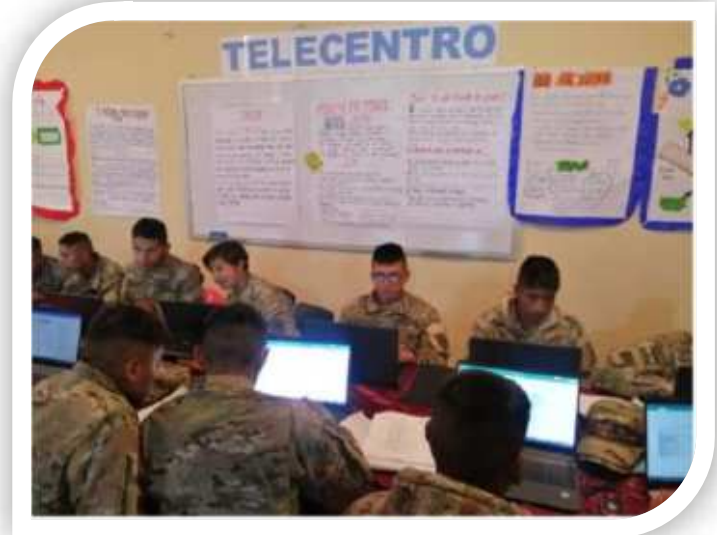
Soldados del Bat.Com. N° 1 “Vidaurre”, en proceso de capacitación técnica