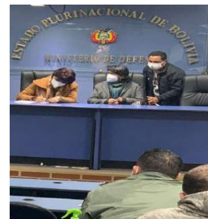
REUNIÓN CON MINISTERIO DE SALUD