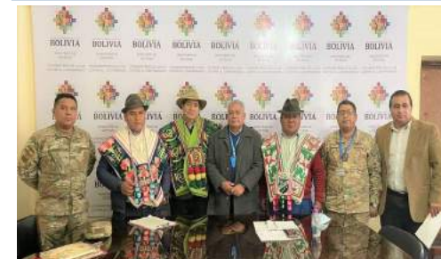
ACUERDOS CON ORGANIZACIONES SOCIALES