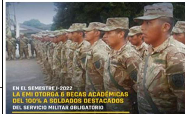
OTORGACIÓN DE BECAS PARA SOLDADOS Y MARINEROS