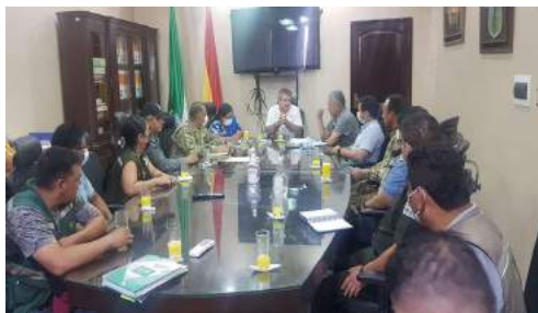
ESPACIOS DE CONCERTACIÓN INSTITUCIONAL