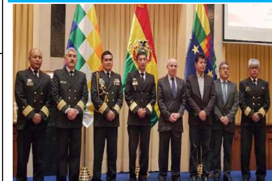
EXPOSICIÓN SERVICIOS PORTUARIOS