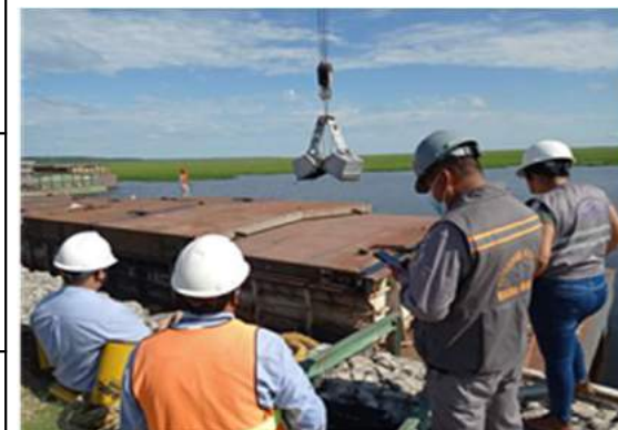
INSPECCIÓN PUERTO JENNEFER