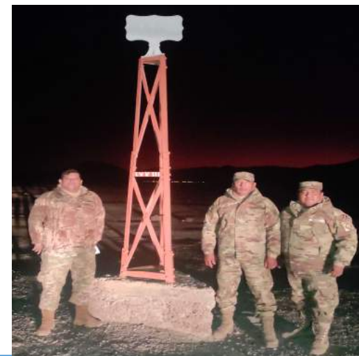
PLAN DE INSPECCIÓN "VILLA MARTIN 22" POTOSÍ. INSPECCION HITO LX MARZO 2022