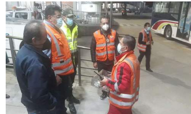
TRANSICIÓN DE SABSA A NAABOL