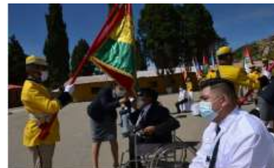
ACTO DE ENTREGA DE LIBRETAS MILITARES A CIUDADANOS CON CAPACIDADES DIFERENTES