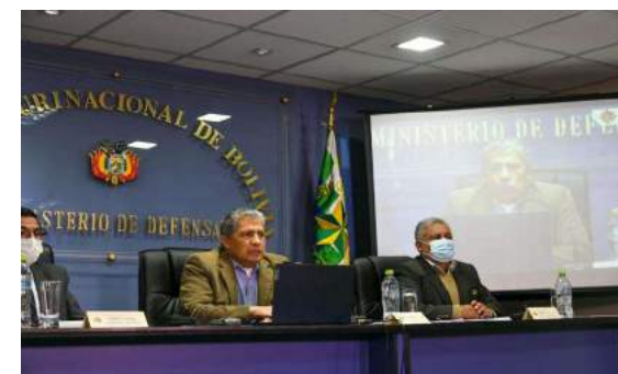
RENDICIÓN PÚBLICA DE CUENTAS FINAL 2021