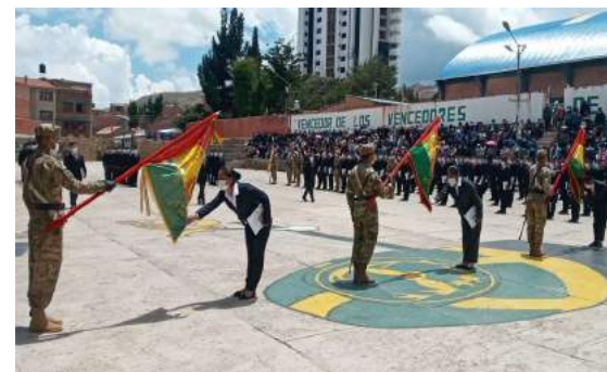
LICENCIAMIENTO DE LOS SOLDADOS Y MARINEROS DEL 1ER. ESCALON CAT./21