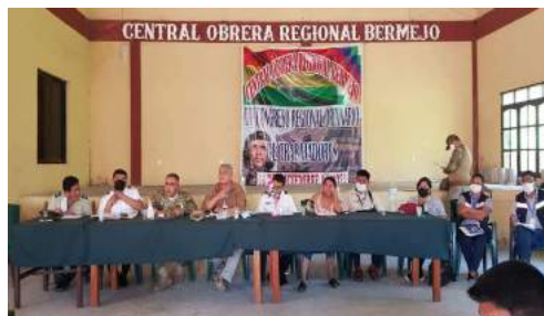
ESPACIOS DE COORDINACIÓN SOCIAL