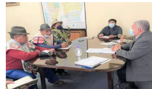
ATENCIÓN A DEMANDAS SOCIALES