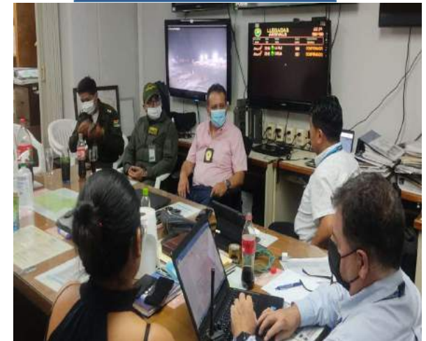
REUNIONES DE SEGURIDAD EN LOS AEROPUERTOS