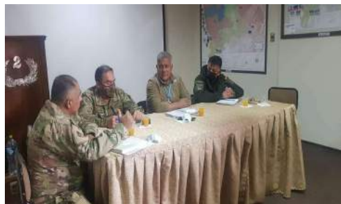
COORDINACIÓN CON EL CEOLCC