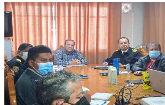
TALLER DE CAPACITACIÓN EN PROYECTOS DE INVERSIÓN PÚBLICA