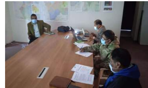
FORMULACIÓN DE ESTRATEGIAS