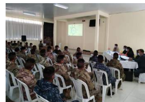
CAPACITACIÓN EN DDHH