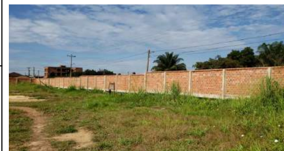
MEJORAMIENTO DE INFRAESTRUCTURA