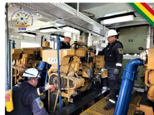
RECONOCIMIENTO A REMOLCADORES HIDROVÍA PARAGUAY - PARANÁ