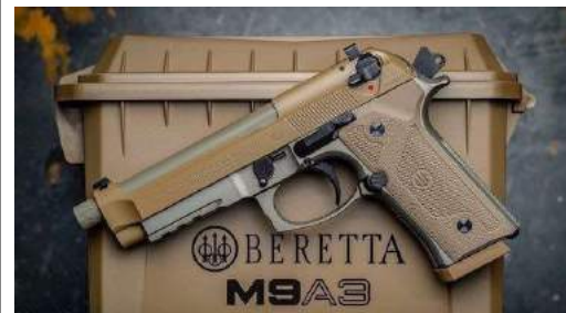
PISTOLA DOTADA PERSONAL DE CUADROS