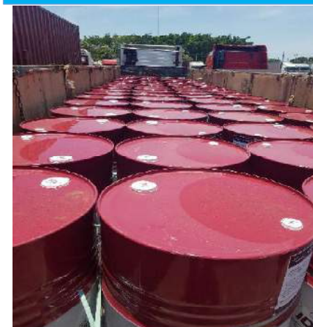
AFORO FÍSICO A LA SUSTANCIA QUÍMICA IMPORTADA