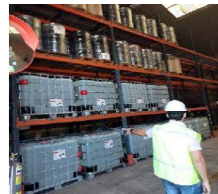
ACTIVIDADES DE INSPECCIÓN