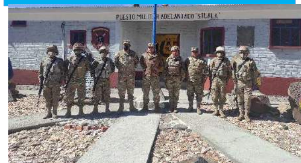
INSPECCIÓN PUESTO MILITAR ADELANTADO "SILALA", MARZO 2022