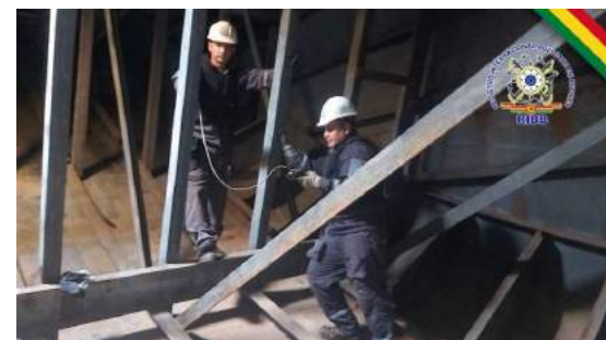
RECONOCIMIENTO A NAVES EN LA HIDROVÍA PARAGUAY - PARANÁ