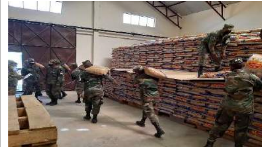
DOTACIÓN DE C-I AL PERSONAL DE TROPA